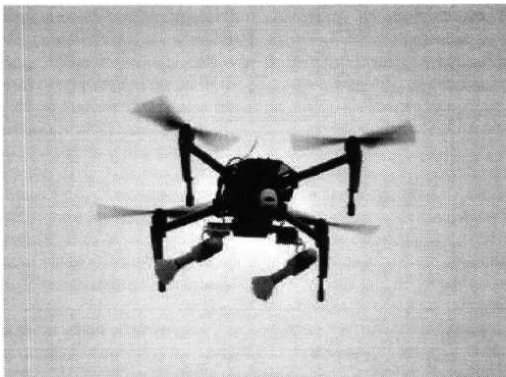
Рис. № 3 – квадрокоптер.

Этот беспилотник может нести до двух взрывных устройств, снабженных стабилизаторами и простейшим контактным взрывателем ударного действия. В качестве системы крепления для гранат боевики используют отрезок пластиковой трубы, в которой с помощью лески закрепляется граната.