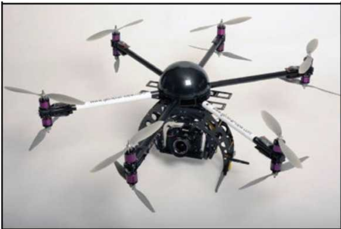
Рис. № 5 – многомоторный БПЛА.

Тип БПЛА, который с каждым днем получают все большее распространение, – многороторные системы. Их еще называют мультикоптерами, квадрокоптерами, гексакоптерами, октакоптерами и тому подобное, в зависимости от количества несущих винтов. Характерная особенность – многомоторная система, принцип полета – подобен вертолетному (рис. № 5).