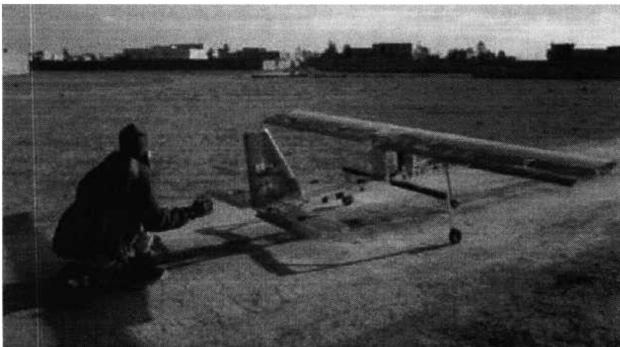
Рис. № 4 – малогабаритный летательный аппарат.

БВС-камикадзе является весьма специфичным классом беспилотной техники, информация о котором чаще всего носит секретный характер. Такой дрон представляет собой малогабаритный летательный аппарат (рис. № 4), способный нести несколько килограмм взрывчатки.