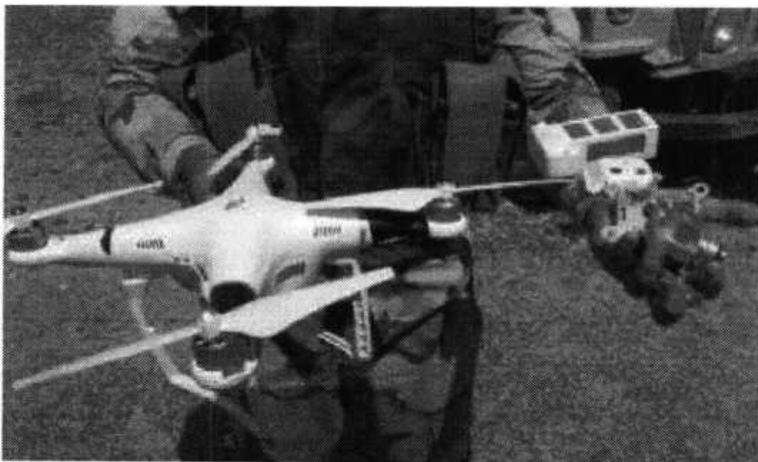
Рис. № 1 – БВС вертолетного типа.

Для совершения диверсионных актов могут использоваться БВС самолетного и вертолетного типа (рис. № 1) кустарного производства, причем доля последних значительно превышает количество самолетных. Объясняется это в первую очередь их более низкой стоимостью.