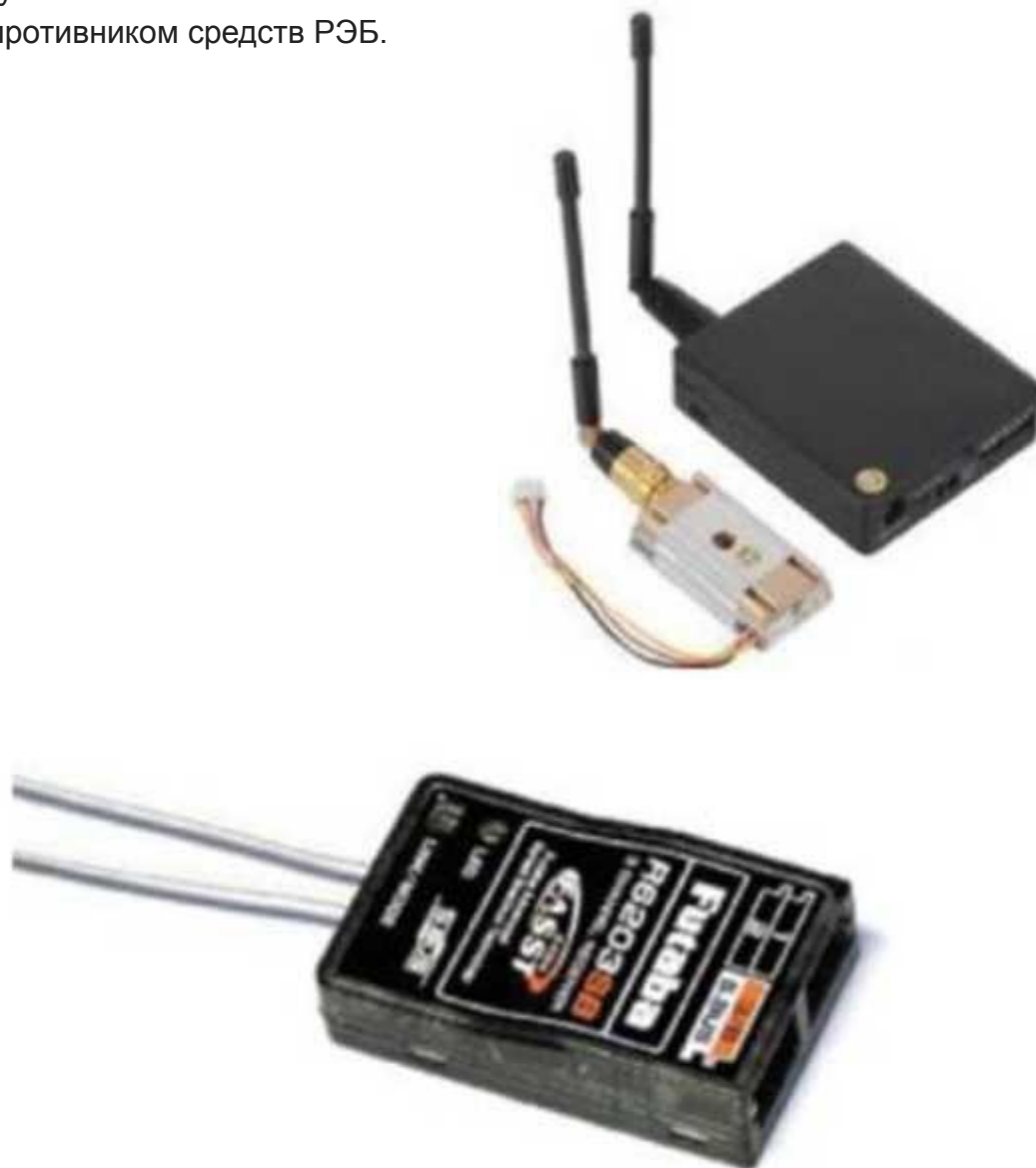
Рис. № 11 – Приемник аппаратуры управления.

Такой режим уменьшает возможность применения противником средств РЭБ.