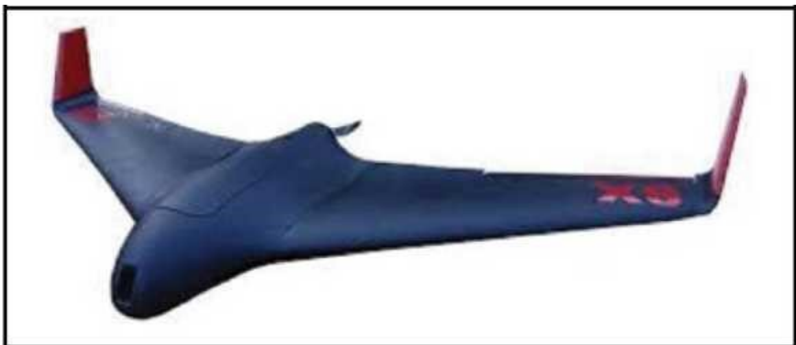
Рис. № 7 – БПЛА тип «летающее крыло».